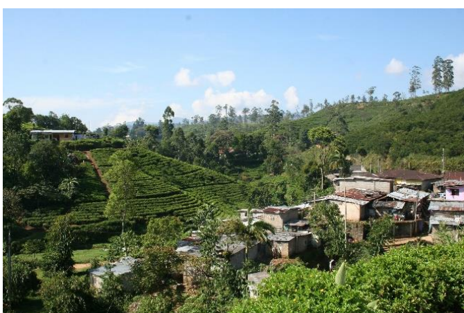
Povodně zasáhly i čajové plantáže, kterými je Srí Lanka vyhlášená.